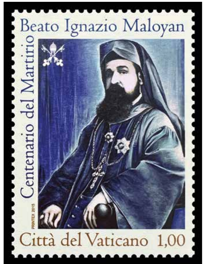
Aus Anlass der Seligsprechung von Erzbischof Maloyan brachte der Vatikan bereits 2015 eine Briefmarke heraus.

Der Erzbischof wurde infolgedessen schwer gefoltert. Am Abend des 10. Juni begannen die Vorbereitungen für