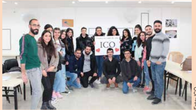
Studenten in Syrien, die vom Kloster mithilfe der ICO unterstützt werden.