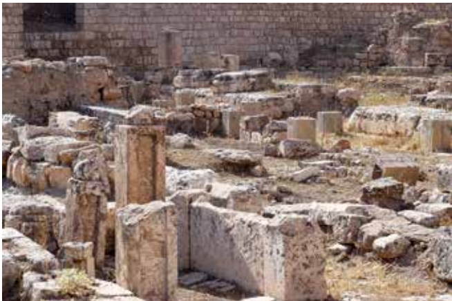
Überreste des antiken Nisibis (heute Nusaybin/Türkei), wo Ephraim viele Jahre wirkte.

Ein besonderes Merkmal der Syrisch-orthodoxen Kirche, das im 20. Jahrhundert wiederbelebt wurde und auf Ephraim zurückgehen soll, sind die „Töchter und Söhne des Bündnisses“ (bnoth w-bnay qyomo), ein geweihter Orden, bestehend aus ledigen liturgischen Sängerinnen und Sängern. Diese Institution soll sich aus der Bewunderung von Ephraim für Frauen, sowohl für die Frauen der Bibel als auch für Frauen im Allgemeinen, ergeben haben. Die ledigen, geweihten Laien, darunter die Frauen, sollten durch dieses Bündnis die tiefe Verbindung zwischen Mensch und Gott verdeutlichen und durch ihren Gesang zum Wohle der Gemeinschaft am Erlösungswerk teilnehmen. Es handelt sich um eine liturgische, lyrische ästhetische und ethische Gemeinschaft.