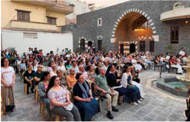
Zahlreiche Gäste aus nah und fern waren zur Diakonweihe gekommen.

mann als „lebendiges Beispiel christlicher Demut und Tatkraft“. Er sei durch seine Hingabe, sein Handeln wie auch durch sein Wissen, seine Denkweise und Demut ein großes Vorbild und wie ein „Vater, der allen nahe ist“.