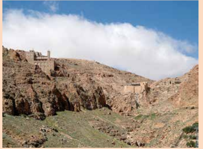
Das Kloster Mar Musa: Alte Klosteranlage (rechts) und neues Kloster (links).